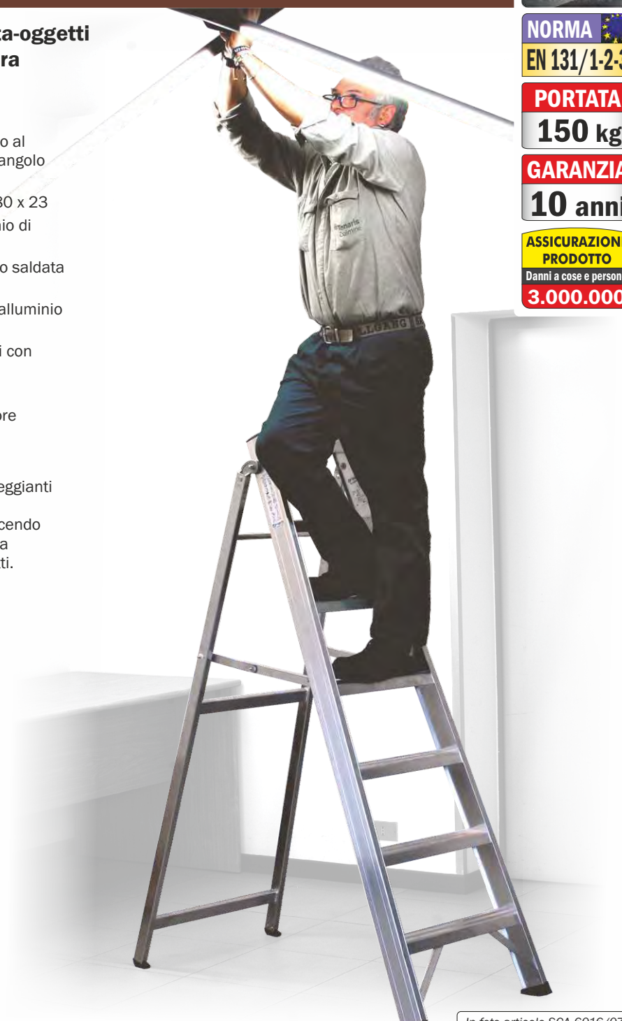
In foto articolo SCA 6016/07

Con nervature di rinforzo in alluminio anti-ruggine saldate contro gli urti laterali e dotata di piedini ad innesto che evitano il distacco accidentale