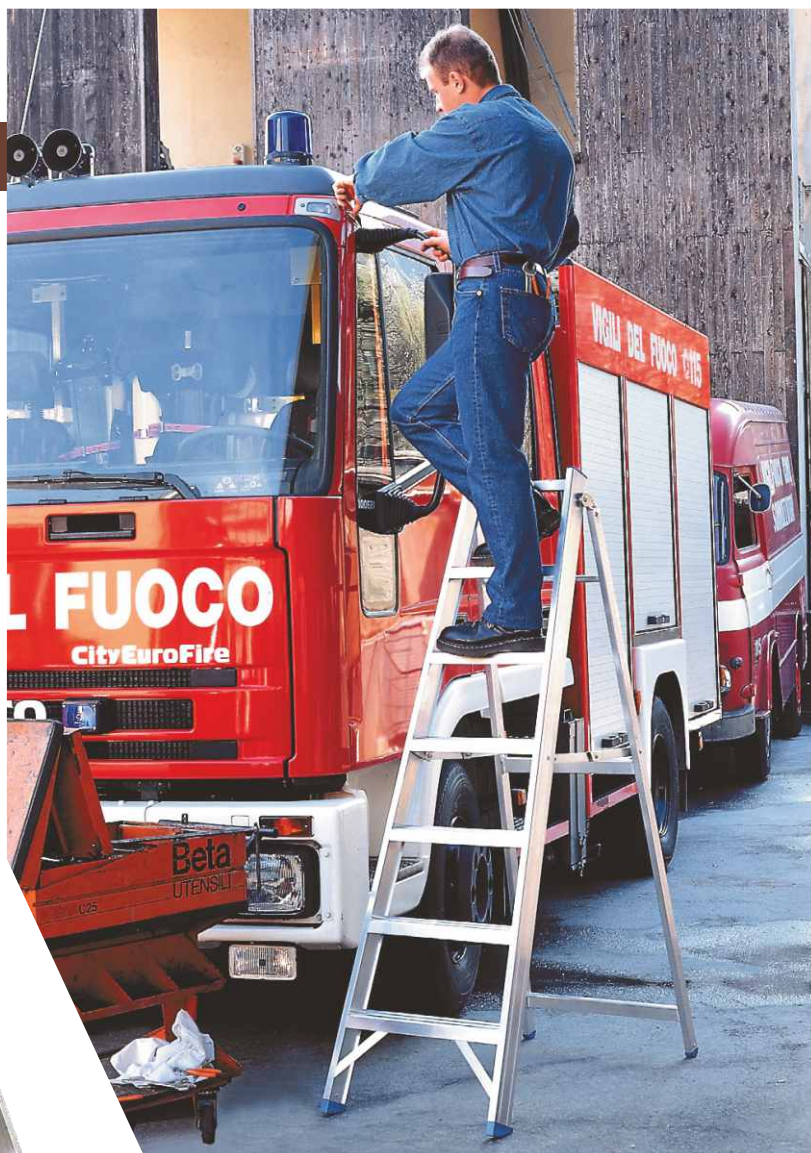
In foto articolo SCA 6016/07