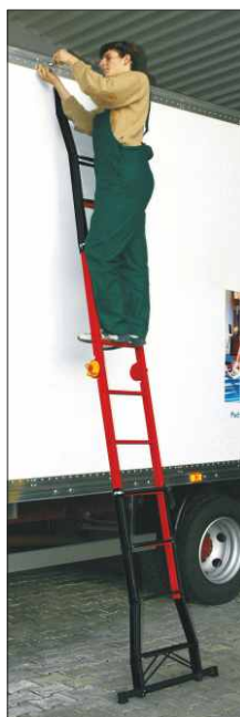
Scala in posizione estesa

Estremità scala con nervature di rinforzo anti-urto