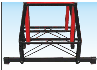
Base rinforzata con tralicciatura resistente agli urti e dotata di basetta stabilizzatrice smontabile