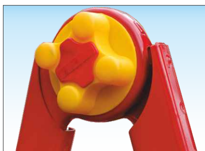
Cerniera a dischi dentati realizzata in acciaio verniciato con stretta manuale mediante pomello a vite realizzato in plastica rinforzata